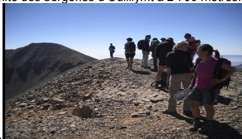
Sommet du M'Goun (pas de neige)

Départ tôt le matin pour atteindre la longue ligne de crête de l'Ighil M'Goun, que nous suivrons jusqu'au sommet, à 4 068 mètres (c'est une montagne de calcaires riches en coquillages, nombreux fossiles sur la crête). Vue exceptionnelle sur l'ensemble du Haut-Atlas central et, au sud, sur la vallée du Dadès, le Sarhro, la hamada du Draa. Descente par le sentier dans un couloir, pour rejoindre le camp à proximité des bergeries d'Oullilymt à 2 700 mètres. Il reste le temps de profiter d'un brin de toilette et bien sûr