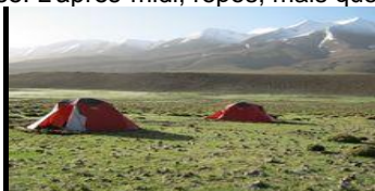
Tente ALLIBERT (3 places pour 2 personnes)

Le sentier suit la rive gauche du ruisseau d'Ikkis jusqu'au cirque de Tiwawakyhe. Au tizi n'Oughri (3340 m), vue remarquable sur le vaste versant nord du M'Goun, sur le plateau de la Tilibiyt N'Tarhddiyt et sur les Tizoula qui dominent la haute vallée de la Tessaout. Installation du campement près des sources de la Tessaout (2900 m), sur de belles pelouses rases entourées de crêtes. Un cadre pastoral et grandiose. L'après-midi, repos, mais quelques petites balades sont possibles, comme par exemple la visite