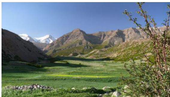
Paysage du Ht Atlas