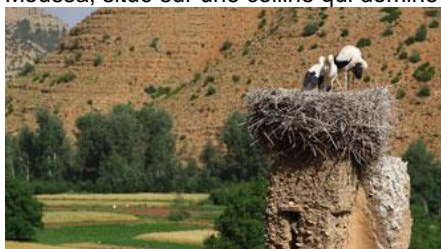
La vallée Heureuse

Montée pour gagner le tizi n'Aït Imi (2905m) ; c'est un passage historique pour les nomades Aït Atta et Aït H'med pour rejoindre les pâturages d'altitude. Vue panoramique sur la fameuse vallée d'Aït Bougmez, nommée la vallée heureuse. Belle descente par un chemin en zigzag (chemin rénové par les équipes Allibert en 2011). Nous profitons d'un petit moment aux sources sacrées d'Aït Immi, les sept moulins, et c'est l'arrivée dans la haute vallée des Bougmez. Pour ceux qui ont encore un peu de courage et envie d'un panorama circulaire, une petite montée permet de visiter le grenier collectif fortifié (en même temps marabout) de Sidi Moussa, situé sur une colline qui domine toute la vallée. Nuit en gîte avec douche à Agouti, chez Ali, un guide de l'équipe Allibert.